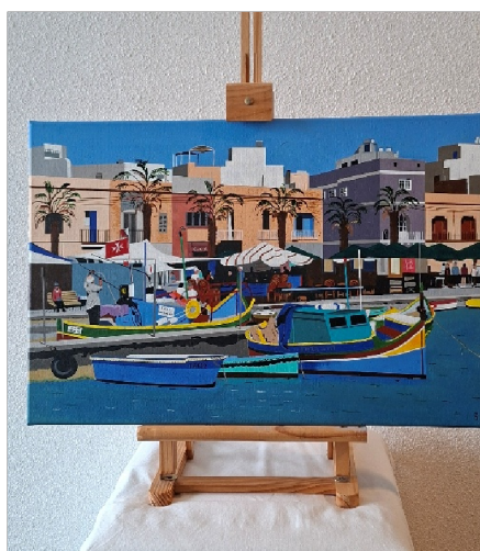
Haventje op Malta

Locatie: Begane grond, route poliklinieken