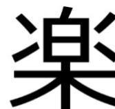
Het Japanse karakter Raku

Raku is een speciale keramische techniek, oorspronkelijk uit China en Korea. Later geperfectioneerd in Japan. Dit alles gebeurde rond de 16e eeuw. Volgens het Zen-boeddhisme is het hoogste schoonheidsgevoel te ervaren in niet perfecte, natuurlijke en eenvoudige dingen. Deze symboliseren de schoonheid van het dagelijkse leven. Dit wordt met raku nagestreefd. Het object wordt met speciale klei gemaakt en gebakken op ca. 900°C, daarna geglazuurd en opnieuw gebakken in een hout- of gasgestookte oven. Wanneer de objecten vanuit de hete raku oven in de koele buitenlucht komen, barst het glazuur door de temperatuurschok van 1.000°C naar 20°C. Dan gaat het object in een ton met bijvoorbeeld zaagsel, dat door de hitte direct vlamvat. Met de deksel op de ton geeft dit een enorme rookontwikkeling, waardoor de grijs/zwarte delen in en op het object ontstaan, tot in de kleinste glazuur barstjes.